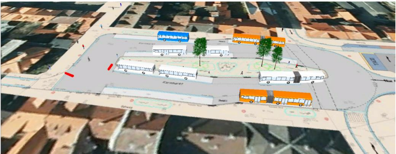
Quellen: Mikrosimulation: WVI GmbH, Luftbild: Google Earth, Lageplan: B/M Consult

Das erarbeitete Linien- und Bedienungskonzept wurde intensiv mit Verwaltung und Politik diskutiert und vom Stadtrat einstimmig zur Umsetzung beschlossen.